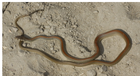
شکل ۵- مار قیطانی.