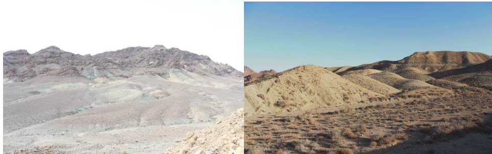
شکل ۱- نماهایی از زیستگاه‌های منطقه شکار ممنوع طالو و شیربند

بر سمی بودن مار گذاشته شد و برای صید آن ابتدا مار را از ناحیه سر مهار و سپس صید انجام شد. پس از مشاهده هر یک از گونه‌ها، یک فرم اطلاعاتی برای آن‌ها تکمیل شد. از جمله اطلاعاتی برای تک تک گونه‌ها ثبت شد، نام گونه (که با استفاده از یک کلید شناسایی معتبر شناسایی انجام شد)، نام محقق، تاریخ مشاهده گونه، ساعت مشاهده، نام جمع‌آوری کننده نمونه، موقعیت جغرافیایی (طول و عرض جغرافیایی)، شرایط جوی، دمای هوا، نوع زیستگاه، نوع پوشش گیاهی، نوع بستر و اطلاعات ریخت‌شناسی و اندازه‌های نمونه ثبت گردید. پس از جمع‌آوری نمونه‌ها و شناسایی و ثبت آن‌ها، تصاویر لازم از هر نمونه با دوربین عکاسی (دوربین ۶۵۰ D Canon و لنز نرمال ۱۸۵۵) تهیه گردید. تعدادی از