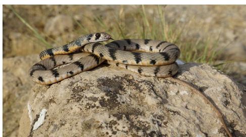
شکل ۴- مار خال‌دار.