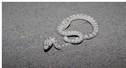
شکل ۶- شترمار.