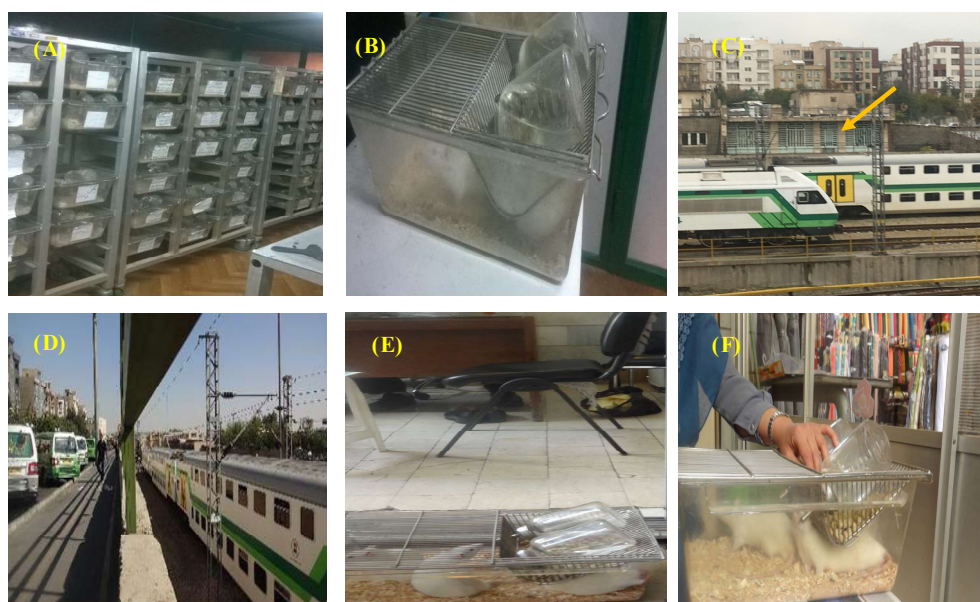
شکل ۱- A-B. محل نگهداری گروه کنترل. C. محل ساختمان اداری رز غربی (اطراف ایستگاه مترو صادقیه. D. خیابان رز غربی. E. گروه تجربی در ساختمان اداری رز غربی. F. گروه تجربی در بازار بزرگ تهران.

Fig. 1. A-B. Control groups. C. West Rose office building location (in the vicinity of Sadeghiyeh metro-station). D. West Rose Street. E. Experimental groups located in West Rose building. F. Experimental groups located in the Tehran Grand Bazaar.