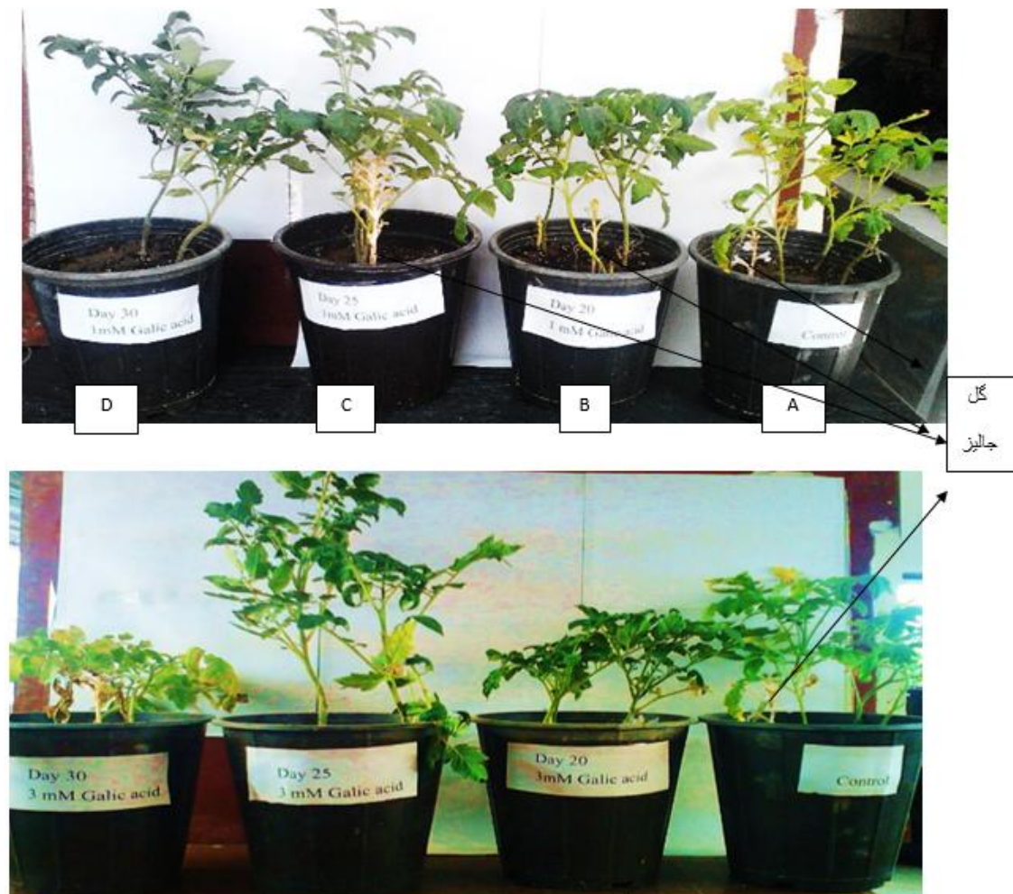
شکل ۱- اثر گالیک اسید (۱ و ۳ میلی‌مولار) در زمان‌های مختلف (۲۰، ۲۵ و ۳۰ روز) بر رشد گوجه‌فرنگی و گل جالیز. A. کنترل (فاقد گالیک اسید). B. تیمار گالیک اسید ۱ میلی‌مولار در روز ۲۰، دارای گل جالیز. C. تیمار گالیک اسید ۱ میلی‌مولار در روز ۲۵، دارای گل جالیز. D. تیمار گالیک اسید ۱ میلی‌مولار در روز ۳۰، فاقد گل جالیز. E. تیمار گالیک اسید ۳ میلی‌مولار در روز ۲۰، دارای گل جالیز. F. تیمار گالیک اسید ۳ میلی‌مولار در روز ۲۵، فاقد گل جالیز. G. تیمار گالیک اسید ۳ میلی‌مولار در روز ۳۰، فاقد گل جالیز.

Figure 1. Effect of gallic acid (1 and 3 mM) in different times (20, 25 and 30 days) on growth of tomato and broomrape. A. Control, gallic acid-free. B. 1 mM gallic acid treatment on day 20, with broomrape. C. 1 mM gallic acid treatment on day 25, with broomrape. D. 1 mM gallic acid treatment on day 30, no broomrape. E. 3 mM gallic acid treatment on day 20, with broomrape. F. 3 mM gallic acid treatment on day 25, no broomrape. G. 3 mM gallic acid treatment on day 30, no broomrape.