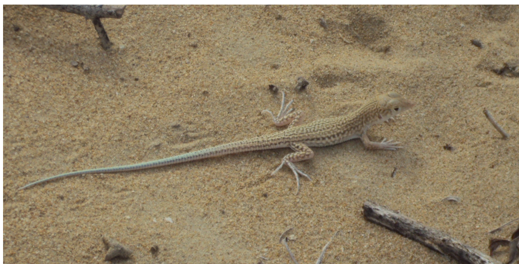
شکل ۱- نمایی از گونه مورد مطالعه A. blanfordi در زیستگاه طبیعی.

در این مطالعه ۴۴ نمونه از مارمولک‌های گونه A. blanfordi (شکل ۱)، در ایران متشکل از ۲۰ نمونه نر و ۲۴ نمونه ماده در جنوب ایران، استان هرمزگان مورد بررسی قرار گرفت. نمونه‌های