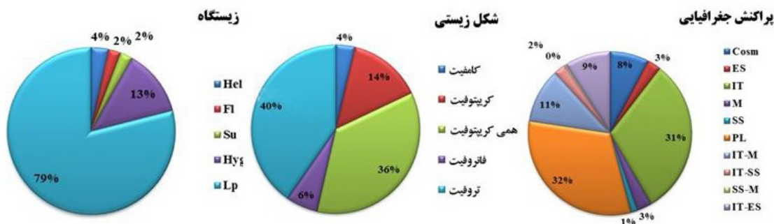
شکل ۲- نمودارهای وضعیت رویشی، شکل زیستی و پراکنش جغرافیایی گونه‌های گیاهی. Figure 2. Habitat, biological form and corology diagrams of plant species.

جدول ۲- فهرست گونه‌های گیاهی شناسایی شده در رویشگاه‌های آبی استان کرمانشاه. علائم اختصاری وضعیت رویشی: Hel= برآمده از آب، Hyd= آبی (Life form): Cha= کامفیت، Cr= کریبتوفیت، Fl= شناور، Su= غوطه‌ور، Hyg= رطوبت‌پسند، Land plant (LP)= گیاهان خشکی؛ شکل‌های زیستی (Life form): Cha= کامفیت، Cr= کریبتوفیت، Hem= همی کریبتوفیت، Pha= فانروفیت، Thr= تروفیت، پراکنش جغرافیایی (Chorotype): Cosm= جهان وطنی، ES= اروپا-سیبری، Hyr= هیرکانی، IT= ایرانی-تورانی، Z= زاگرسی، M= مدیترانه‌ای، PL= چند ناحیه‌ای، SS= صحاراسندی.