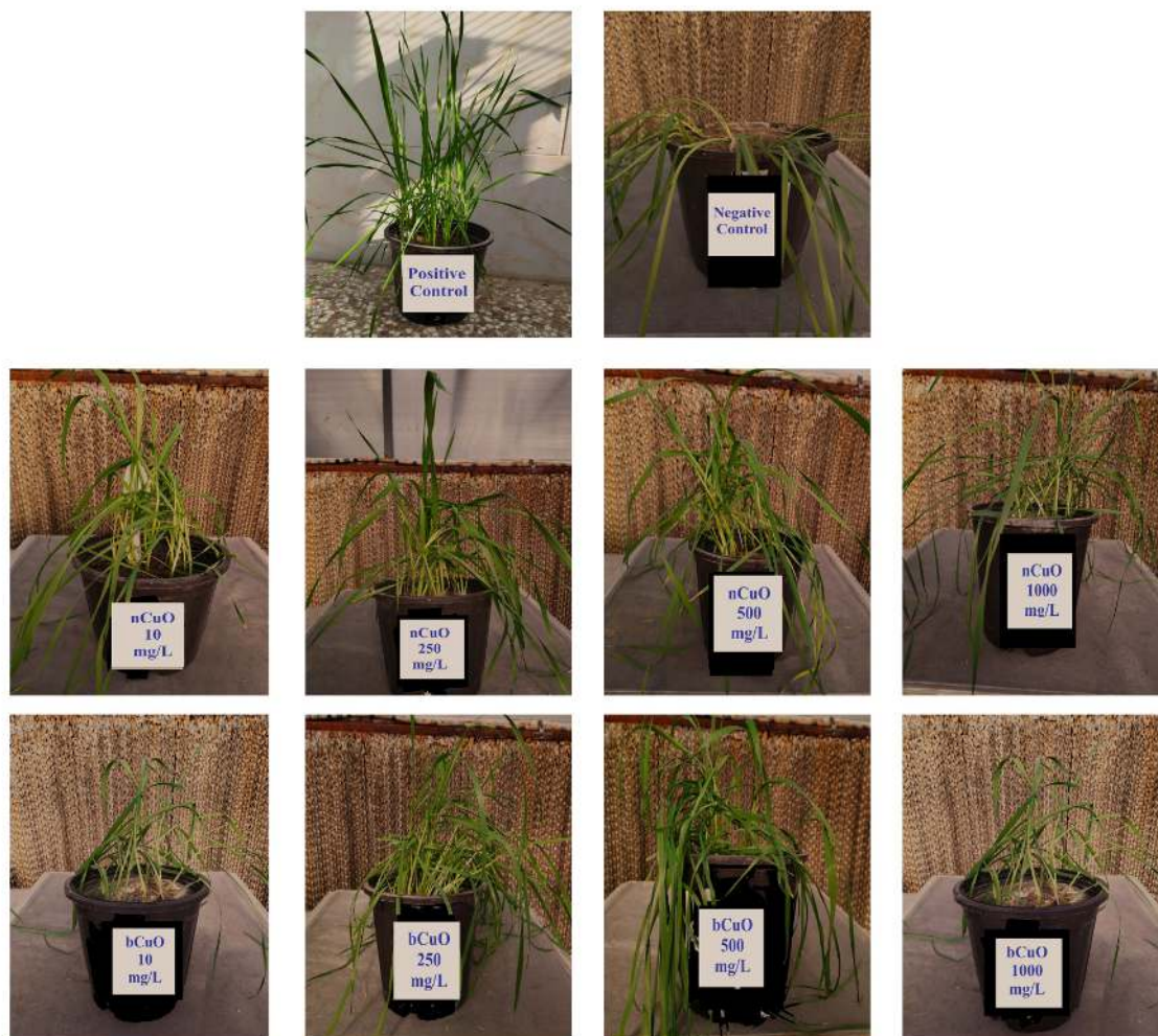
شکل ۱- نمایی از گندم (رقم روشن) طبیعی (کنترل مثبت)، گیاه آلوده به قارچ (کنترل منفی)، گیاهان تیمارشده با نانوذرات مس اکسید (nCuO) و گیاهان تیمارشده با فرم توده ذرات مس اکسید (bCuO).