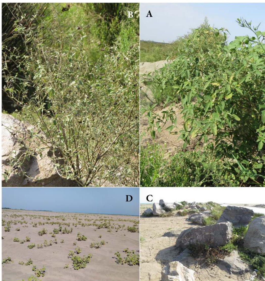
شکل ۱- نمایی از Solanum chenopodioides و رویشگاه آن، A. مرحله گل دهی، B. مرحله میوه دهی، C. محل جمع آوری، D. رویشگاه ساحلی بکر پارک ملی بوجاق. Figure 1. Solanum chenopodioides and its habitat, A. in flowering, B. in fruiting, C. place of collection, D. coastal habitat of Bujagh National Park.

کرک دار، سطح زیرین سبز کم رنگ، سطح رویی سبز پرنگ. حاشیه برگ‌ها کامل یا موج، نوک گرد، کند یا تیز؛ دمیرگ 1/5-1 سانتی‌متر طول، با کرک‌های پراکنده. گل آذین 1-2.5 سانتی‌متر طول. عموماً میان‌گرهی، یا در شاخه‌های جوان مقابل برگ، ساده یا دو شاخه، نیمه چتری، با 3 تا 7 گل، کرک‌دار، دمگل‌ها 0/1-5 سانتی‌متر، در زمان میوه‌دهی به سمت پایین خم شونده. گل‌ها کامل. کاسه 1-1/5 میلی متر طول، کاسه گوه‌ای، لب‌ها سه گوش پهن، در راس نوک کند تا نوک تیز. با کرک‌های شبیه ساقه اما کمی کوتاه‌تر. جام 6-10 میلی‌متر عرض، به طور عمیق چاک‌دار، لب‌ها در هنگام گرد افشانی برگشته سپس پراکنده، سفید با بخش درونی قاعده‌ای تیره یا سبز-زرد. پرچم‌ها مساوی،