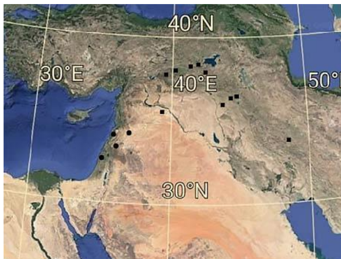
شکل ۳- پراکنش گونه‌های S. melampyroides (■) و S. neurocalycina (●).