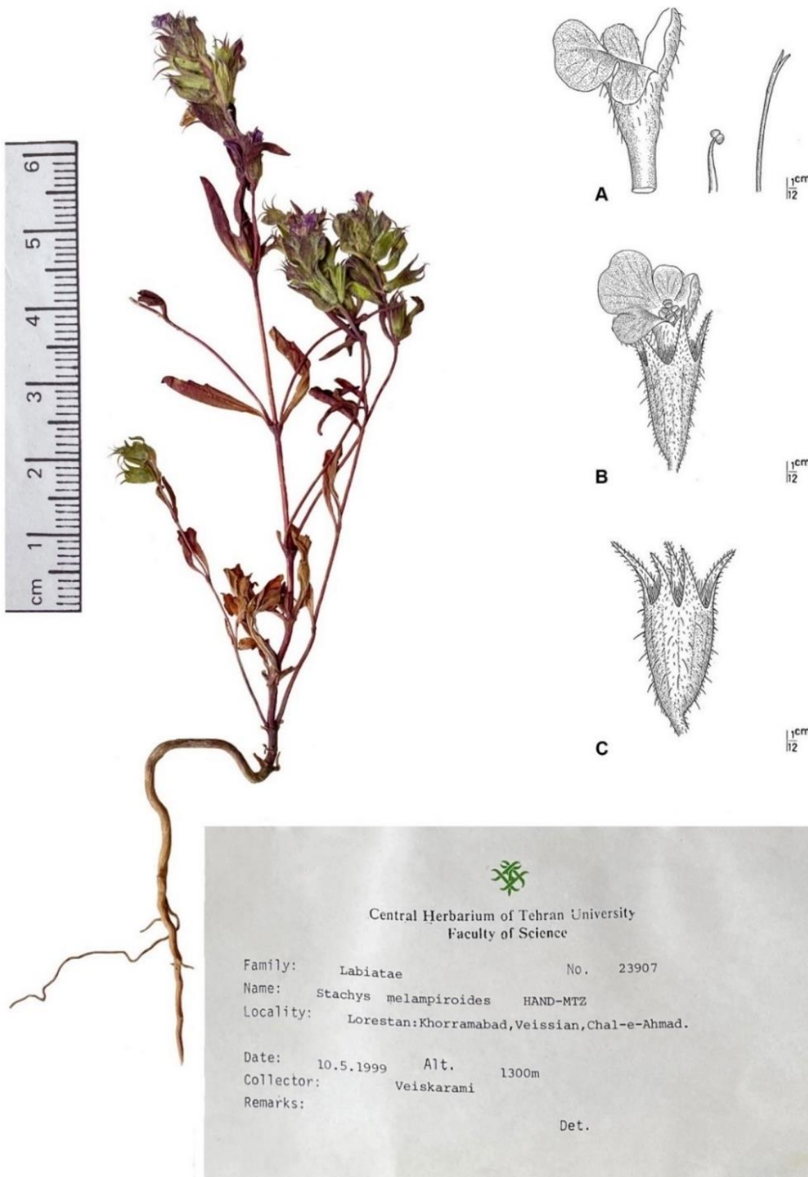
شکل ۱- نمونه گیاهه‌ای گونه S. melampyroides در گیاهکده مرکزی دانشگاه تهران. A. جام گل، B. گل، C. کاسه گل (Salmaki et al., 2012). Figure 1. The herbarium specimen of S. melampyroides in the Central Herbarium of Tehran University. A. corolla, B. flower, C. calyx (Salmaki et al., 2012).