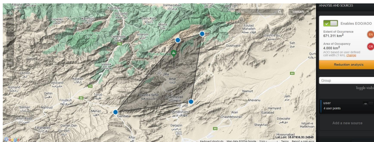
شکل ۴- محدوده حضور و سطح تحت اشغال گونه Seseli olivieri

تعداد پایه‌های بالغ و دانه‌رست S. olivieri در سه رویشگاه به ترتیب ۲۰۳ و ۲۷ شمارش شد. چرای دام و خشکسالی باعث تخریب جمعیت‌های این گونه و رویشگاه‌های آن شده است. با توجه به اینکه سطح تحت اشغال این گونه در جمعیت‌های