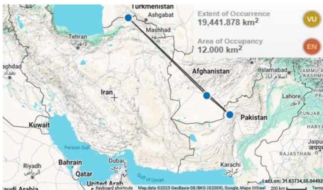
شکل ۳- نقشه وضعیت حفاظتی Astragalus suffalcatus Bunge Figure 3. Conservation status map of Astragalus suffalcatus Bunge

ارزیابی حفاظتی انجام شده نشان می‌دهد که این گونه از نظر سطح تحت اشغال (AOO) در رده در خطر انقراض (EN) و از نظر گستره پراکنش (EOO) در رده آسیب‌پذیر (VU) قرار می‌گیرد. این تفاوت بیانگر آن است که اگرچه پراکنش کلی گونه در سه کشور ایران، افغانستان و پاکستان وسیع است، اما جمعیت‌های آن احتمالاً به صورت لکه‌ای و با تراکم پایین حضور دارند. چنین الگویی در بسیاری از گونه‌های بومی و نیمه‌خشک سرده Astragalus مشاهده می‌شود که در زیستگاه‌های تخصصی و محدود استقرار یافته‌اند و در برابر تغییرات کاربری اراضی و تخریب زیستگاه حساس‌اند.