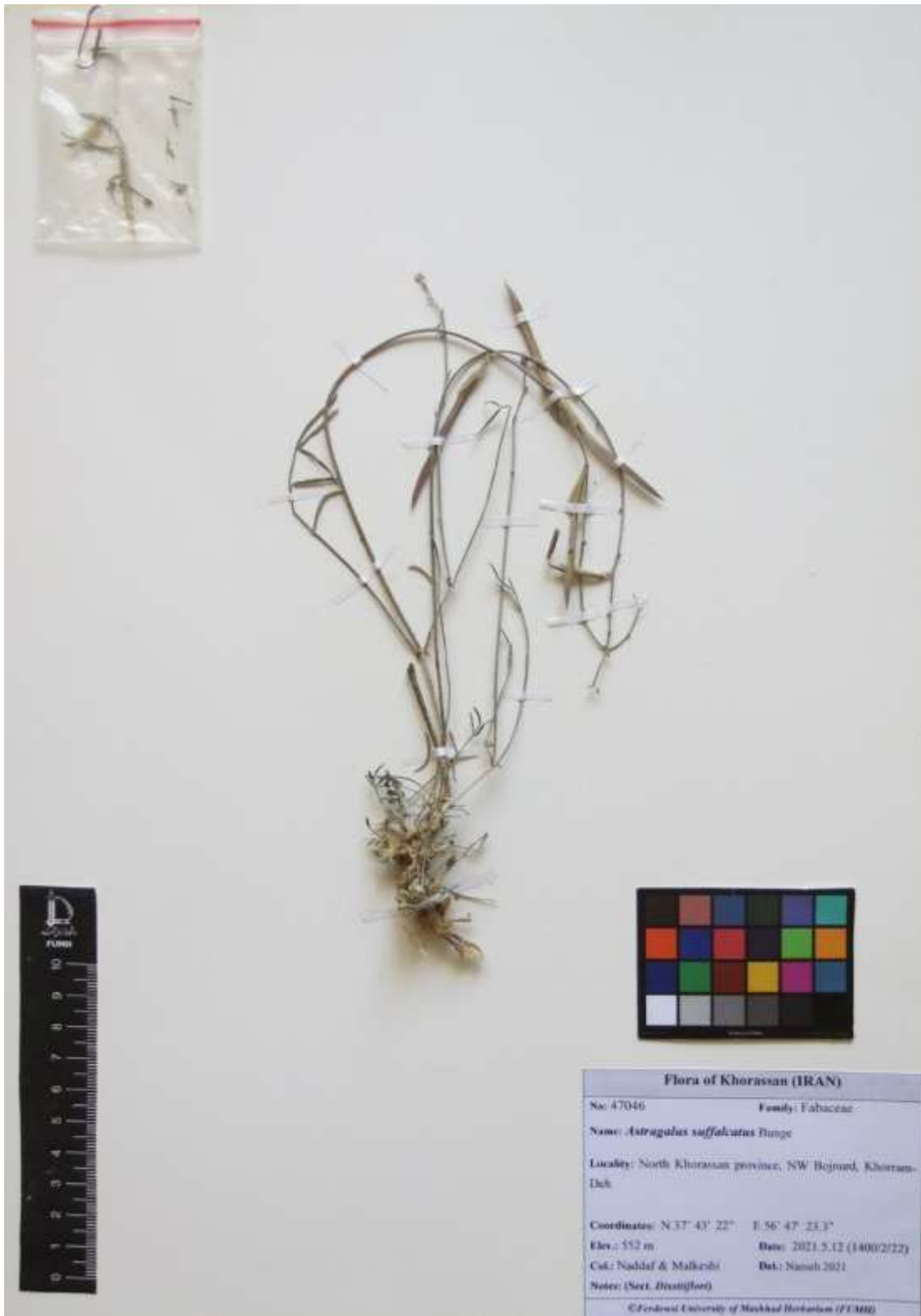
شکل ۱- تصویری از Astragalus suffalcatus Bunge Figure 1. Image of Astragalus suffalcatus Bunge