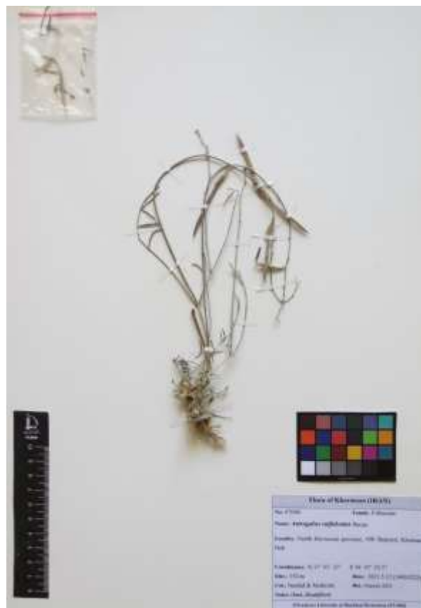
Figure 2. Image of Astragalus suffalcatus Bunge

Leaves are 3–6 cm long, with 2–4 pairs of narrowly ovate to elliptic leaflets, densely pubescent on both surfaces. Inflorescences are racemose, initially dense and 8–10-flowered, later elongating up to 8 cm. Bracts are narrow and triangular. Pods are linear, 30–50 mm long, cylindrical, bilocular, with a short stipe, slightly grooved dorsally, and covered with appressed white hairs; the fruit wall is firm and straw-colored at maturity (Figure 2).