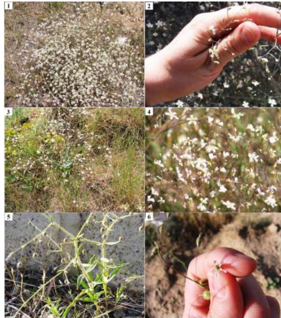
شکل ۳- (۱، ۲) Gypsophila polyclada var. polyclada . (۳، ۴) Gypsophila polyclada var. leioclada . (۵، ۶) Gypsophila pilosa var. pilosa .

Fig. 3. (1, 2) Gypsophila polyclada var. polyclada . (3, 4) Gypsophila polyclada var. leioclada . (5, 6) Gypsophila pilosa var. pilosa .