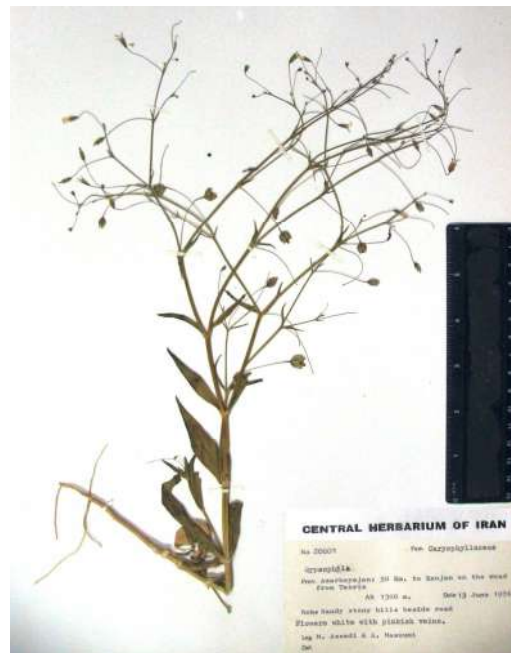
شکل ۴- Gypsophila pilosa var. glabra (هولو تایپ TARI).

Fig. 3. (1, 2) Gypsophila polyclada var. polyclada . (3, 4) Gypsophila polyclada var. leioclada . (5, 6) Gypsophila pilosa var. pilosa .