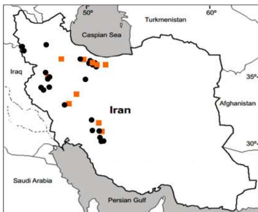
شکل ۵- پراکنش نمونه‌های مطالعه‌شده دو واریته G. polyclada var. leioclada (■) و G. polyclada var. polyclada (●).

Fig. 5. Distribution of the studied specimens of two varieties, G. polyclada var. leioclada (■) and G. polyclada var. polyclada (●).