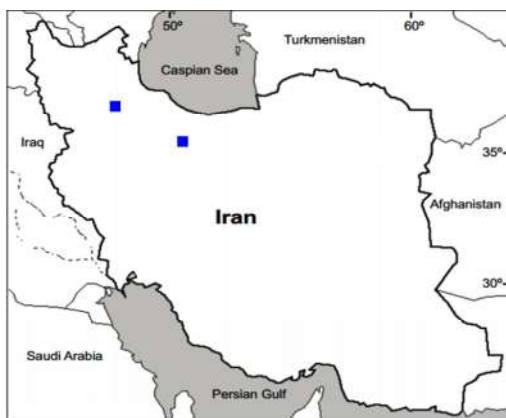
شکل ۶- پراکنش نمونه‌های مطالعه‌شده واریته G. pilosa var. glabra (■).

Fig. 5. Distribution of the studied specimens of two varieties, G. polyclada var. leioclada (■) and G. polyclada var. polyclada (●).