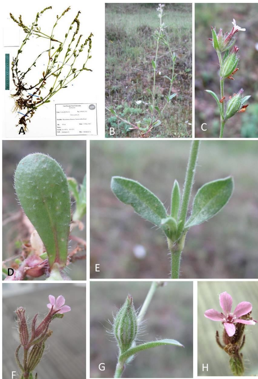
شکل ۲- Silene gallica : A: نمونهٔ هرباریومی SPNH-2292، B: نمای طبیعی گیاه، C: گل آذین، D: برگ قاعده‌ای، E: برگ ساقه‌ای، F: شکل کاسه در زمان گل، G: شکل کاسه در زمان میوه، H: نمای گل.

Fig. 2. Silene gallica : A: herbarium specimen SPNH-2292, B: plant habit, C: inflorescence, D: basal leaf, E: cauline leaf, F: calyx shape in anthesis phase, G: calyx shape in fruiting phase, H: flower.