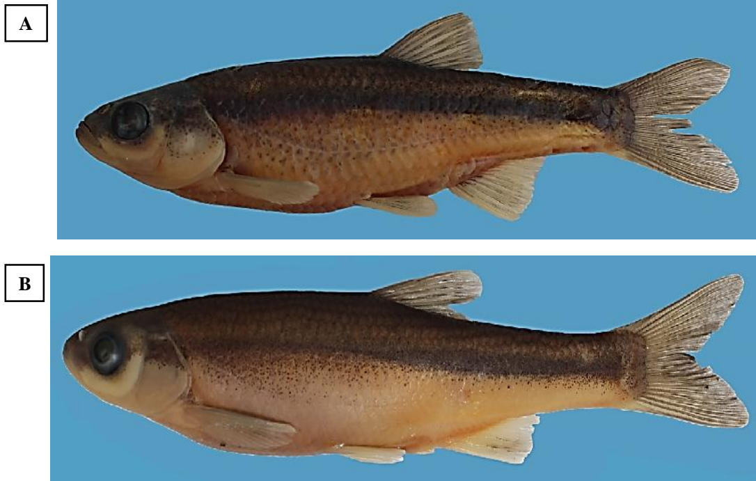
شکل ۱- نمای جانبی دو گونه P. ulanus (A) و A. atropatena (B) صید شده از رودخانه مهابادچای، حوضه دریاچه ارومیه. Figure 1. Lateral view of Petroleuciscus ulanus (A) and Alburnus atropatena (B) collected from the Mahabad-Chi River, Urmia Lake basin.