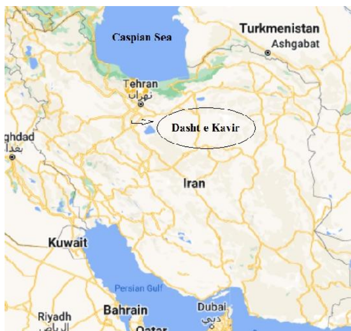
شکل ۱- نقشه مکان نمونه برداری. فلش مکان نمونه برداری را نشان می‌دهد.

خاک‌های پر شور، محیط‌هایی سخت و در عین حال در تمام نقاط جهان گسترده شده‌اند (Oren, 2006). در این محیط‌ها خاک ریزوسفر گیاهان به دلیل دارا بودن ترشحات گیاهی، منبعی غنی از اکتینومیست‌های هالوفیل به شمار می‌آید. به این معنا که تعداد و تنوع میکروبی در ریزوسفر در مقایسه با خاک اطرافش بسیار بیشتر است. در محیط‌های پرشور بقای اکتینومیست‌های همزیست با گیاه، به نمک‌های مختلف در این اکوسیستم‌ها بستگی دارد که اغلب تراکم سلولی بالایی را حفظ می‌کنند و منابع مهمی برای آنزیم‌ها با ویژگی‌های مناسب برای کاربرد در صنعت هستند (Ma et al., 2010). غربالگری چنین