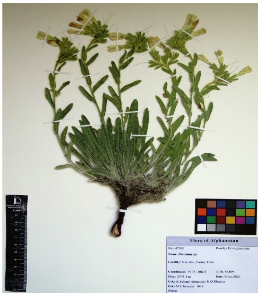
شکل ۳- نمونه O. nuristanica در هرباریوم FUMH (۴۷۶۲۰). Figure 3. The specimen of O. nuristanica in the herbarium of FUMH (47620).