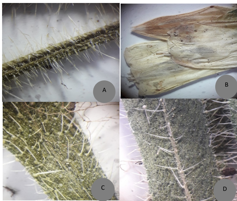
شکل ۴- استریو-میکروگراف پوشش کرک از O. nuristanica : A. ساقه، B. جام گل، C. سطح بالای برگ، D. سطح پایینی برگ.

Figure 4. Stereo-micrographs of indumentum of O. nuristanica : A. stem, B. corolla, C. upper leaf surface, D. lower leaf surface.