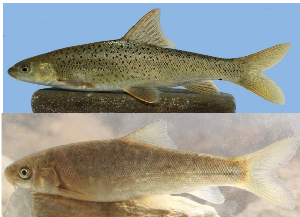
شکل ۱- نمایشی جانبی از دو گونه سیاه‌ماهی، بالا: Paracapoeta trutta و پایین: Capoeta damascina رودخانه سیروان Fig 1. The lateral view of Paracapoeta trutta (upper) and Capoeta damascina (below) from Srirvan River