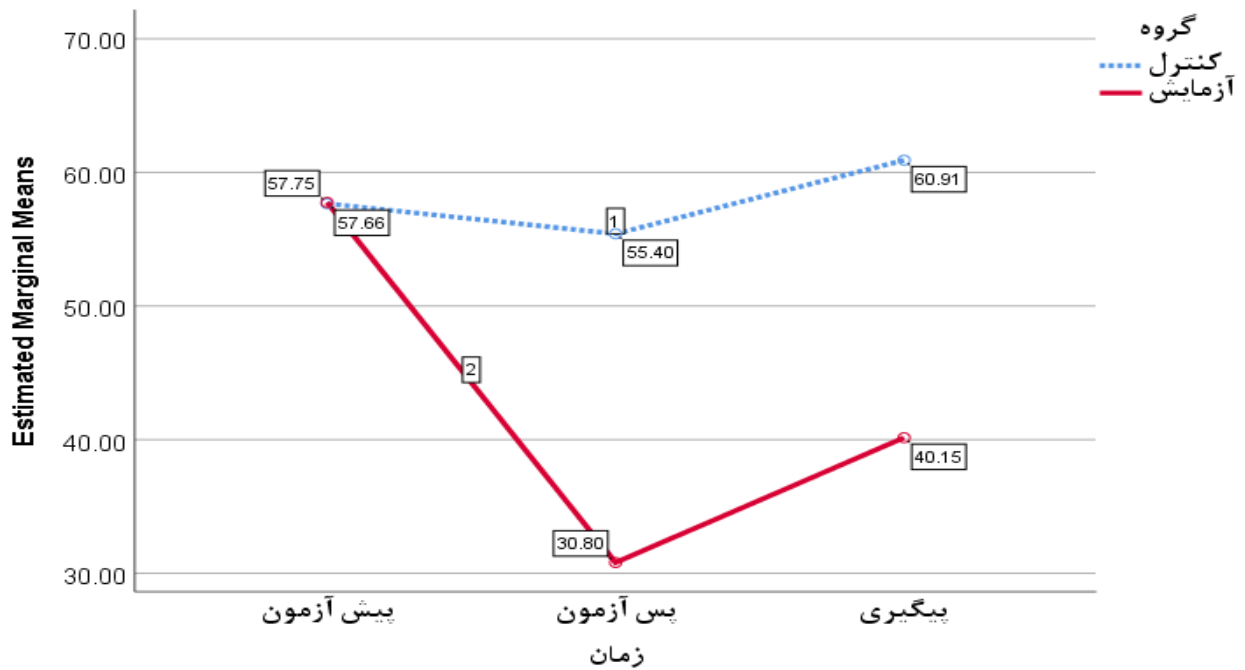
نگاره ۲. مقایسه میانگین فرسودگی تحصیلی در سه حالت پیش آزمون، پس آزمون و پیگیری به تفکیک گروه آزمایش و کنترل