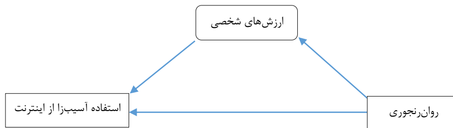
شکل ۱- مدل مفهومی استفاده آسیب‌زا از اینترنت بر اساس روان‌رنجوری و نقش میانجی‌گری ارزش‌های شخصی

(۵۲)، اختلال وسواسی-اجباری (۵۳)، اختلال سوءمصرف مواد (۴۱) و سرطان (۵۴) مورد تأیید قرار گرفته است، ولی تاکنون پژوهش خاصی که بر روی ارتباط ارزش‌های شخصی و اعتیاد به اینترنت متمرکز شده باشد، انجام نشده است که با توجه به ماهیت اعتیادی این رفتار و شیوع زیاد آن در جامعه پرداختن به این مسأله می‌تواند از جایگاه مهمی برخوردار باشد. چرا که نتایج پژوهش‌های بی‌شماری که در بالا اشاره شد، از این یافته حمایت می‌کنند که یکی از خلاءهای موجود در آسیب‌شناسی شناختی رفتاری اختلال‌های روانشناختی نپرداختن به ارزش‌های شخصی افراد به‌عنوان یک عامل محافظت‌کننده در ارتباط با آسیب‌پذیری نسبت به طیف زیادی از پیامدها و مشکلات روانشناختی است. ارزش‌های شخصی افراد به عنوان یک بعد پیچیده و درهم‌تنیده روانی، اجتماعی، فرهنگی و معنوی (۴۲) می‌تواند تحمل درد و پریشانی را برای رسیدن به اهداف متعالی و بلندمدت محقق کند و از آنجایی که کشور ایران یک کشوری با الگوهای ارزشی کهن است (۵۵)، پرداختن به این ارزش‌ها در