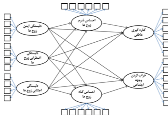
شکل ۱. الگوی پیشنهادی پژوهش