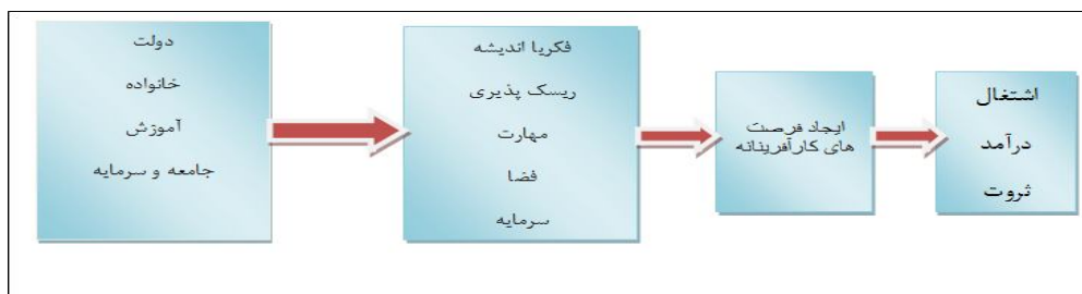
شکل شماره (۱): روند کارآفرینی یا اکوسیستم کارآفرینی

واژه کارآفرینی از کلمه فرانسوی Entrepreneur به معنای متعهد شدن نشأت گرفته است. بنابر تعریف واژنامه دانشگاهی وبستر، کارآفرین کسی است که متعهد می‌شود مخاطره‌های یک فعالیت اقتصادی را سازماندهی، اداره و تقبل کند (احمدپورداریانی، ۱۳۸۷: ۴). عمل کارآفرینی اشاره به کشف، ارزیابی و بهره‌برداری از فرصت‌ها (Shane et al., 2000: 219) و شناسایی فرصت‌های قابل دوام و پایدار است (Martin et al., 2010: 482) و می‌توان آن را معادل نوآوری تعریف کرد (Lauwere et al, 2002: 3) که باعث ایجاد هیجان و انگیزه و همچنین رشد و پیشرفت اقتصادی می‌شود (Pablo Couyoumdjian, 2012: 158). کارآفرینی باعث خلق نوآوری و قبول مخاطرات و منافع آن است (Hisrich et al., 2005: 8). در شکل ۱ روند شکل‌یابی کارآفرینی و ثمرات آن نشان داده شده است.