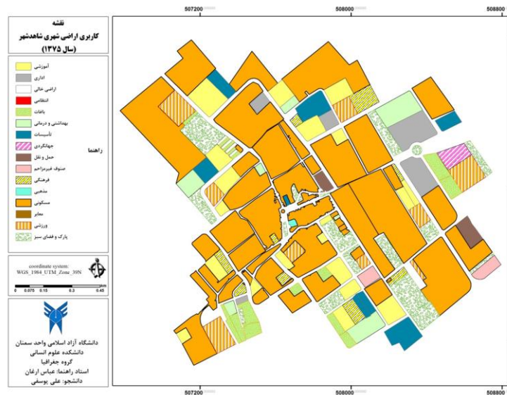
شکل شماره (۱) نقشه کاربری اراضی شاهد شهر در سال ۱۳۷۵