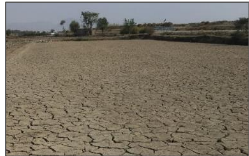
شکل ۲. عدم کشت و رهاسازی شالیزار در ناحیه لنجان علیا