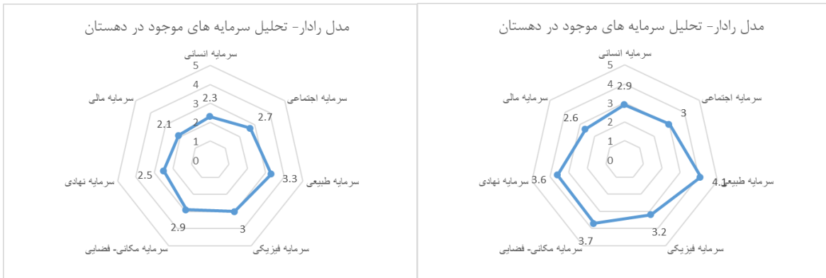
شکل ۷. نمودار راداری دهستان جون آباد