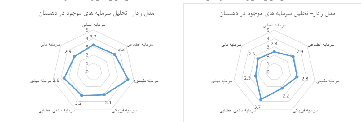
شکل ۵. نمودار راداری دهستان تمین