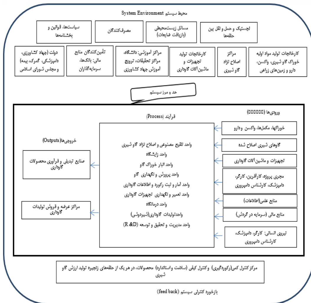
شکل ۱. مدل مفهومی تحقیق