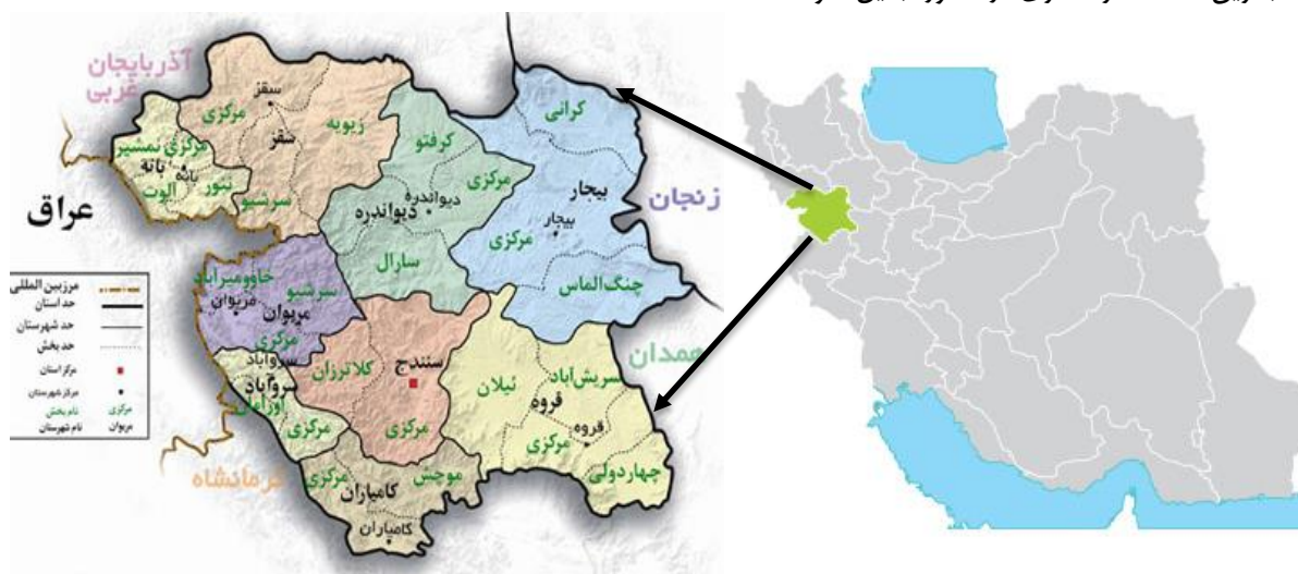
شکل ۲. موقعیت جغرافیایی محدوده مطالعاتی

استان کردستان یکی از استان‌های ایران به مرکزیت شهر سنندج است که در غرب کشور واقع شده است. مساحت این استان ۲۸۲۰۰ کیلومتر مربع معادل ۱/۷ درصد مساحت کل کشور ایران است. این استان که در دامنه‌ها و دشتهای پراکنده سلسله جبال زاگرس میانی قرار گرفته است، از شمال به استان‌های آذربایجان غربی و زنجان، از شرق به همدان و زنجان، از جنوب به استان کرمانشاه و از غرب به اقلیم کردستان و کشور عراق محدود است. استان کردستان با کشور عراق ۲۰۰ کیلومتر مرز مشترک دارد. استان کردستان براساس آخرین تقسیمات کشوری در سال ۱۳۹۰ دارای ۱۰ شهرستان، ۲۹ شهر، ۳۱ بخش، ۸۶ دهستان و ۱۶۹۷ آبادی دارای سکنه و ۱۸۷ آبادی خالی از سکنه بوده است. شهرستان‌های این استان عبارتند از: مریوان، بیجار، دهگلان، دیواندره، سروآباد، سقز، سنندج، قروه، کامیاران و بانه. بر پایه سرشماری عمومی نفوس و مسکن سال ۱۳۹۵ استان کردستان ۱۶۰۳۰۱۱ نفر جمعیت دارد که ۶۶ درصد شهری و ۳۴ درصد را جمعیت روستایی تشکیل می‌دهد. تراکم نسبی جمعیت معادل ۲/۵۱ نفر در کیلومتر مربع است. موقعیت جغرافیایی استان کردستان، آب‌وهوای مطبوع و طبیعی، وجود تفرجگاه‌های جنگلی، آبشارهای فصلی، صنایع دستی و سوغات محلی، مجاورت در مرز اقلیم کردستان عراق و وجود کالاهای خارجی ارزان قیمت، این استان را به یکی از جذاب‌ترین مقاصد گردشگری در کشور تبدیل نموده است.