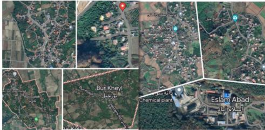
شکل ۲. محدوده مورد مطالعه در تقسیمات استان مازندران