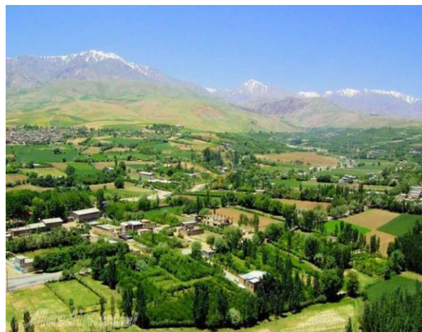
شکل ۵. تغییر چشم‌انداز روستا شهر کلدشت بر اثر ساخت خانه‌های دوم، مأخذ (نگارندگان: ۱۴۰۲)