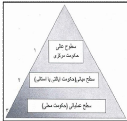
شکل شماره (۲): حوزه عملکرد شوراهای ایران (نصر، همان)