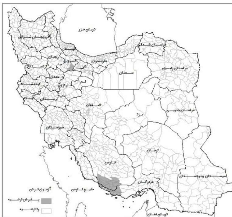
شکل شماره (۱۱): آزمون فرضیه افزایش نرخ بیکاری جمعیت زنان روستایی طی دوره ۹۰-۱۳۸۵