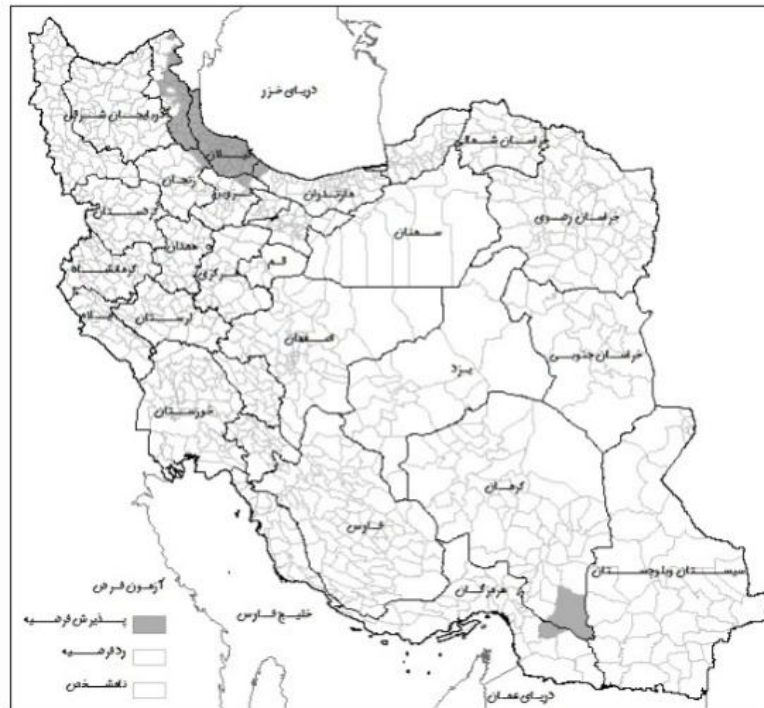
شکل شماره (۱): آزمون فرضیه افزایش فعالیت عمومی مردان روستایی طی دوره ۹۰-۱۳۸۵