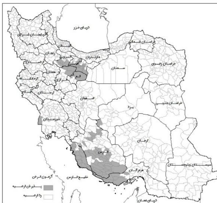
شکل شماره (۱۲): آزمون فرضیه افزایش نرخ بیکاری جمعیت روستایی طی دوره ۹۰-۱۳۸۵