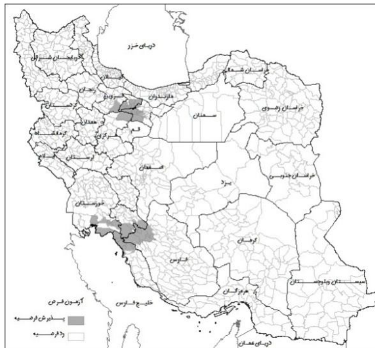
شکل شماره (۵): آزمون فرضیه افزایش نرخ مشارکت اقتصادی جمعیت زنان روستایی طی دوره ۹۰-۱۳۸۵