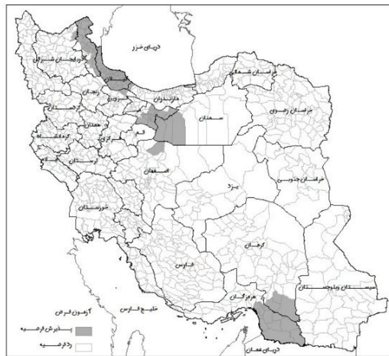
شکل شماره (۲): آزمون فرضیه افزایش فعالیت عمومی زنان روستایی طی دوره ۹۰-۱۳۸۵