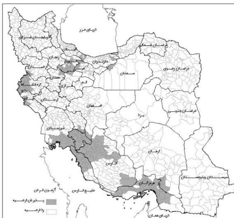
شکل شماره (۶): آزمون فرضیه افزایش نرخ مشارکت اقتصادی کل جمعیت روستایی طی دوره ۹۰-۱۳۸۵

یکی از چالش‌هایی که کشور در حال حاضر با آن مواجه است، افزایش تعداد بی‌شماری جمعیت واقع در سن کار و فعالیت می‌باشد که برای آن‌ها باید شغل و فعالیتی به وجود دارد. وجود نیروی جوان و آماده به کار خود به عنوان پتانسیلی برای رشد اقتصادی کشور و به حرکت در آوردن چرخ‌های اقتصادی جامعه محسوب می‌شود ولی اگر برنامه‌ریزی درستی برای آن وجود نداشته باشد خود به عنوان تهدیدی برای جامعه محسوب خواهد شد. در برنامه‌های توسعه اقتصادی و اجتماعی کشور بر ایجاد اشتغال تاکید زیادی شده است و راهکارهای اجرایی زیادی نیز برای آن پیش بینی شده است.