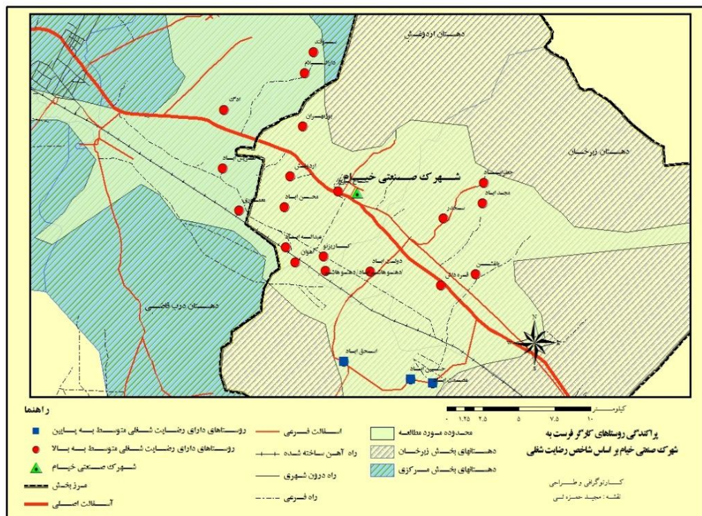
شکل شماره (۲): نقشه وضعیت رضایت شغلی در روستاهای منتخب

با توجه به غیرنرمال بودن توزیع مقادیر این متغیر برای ارزیابی آن از آزمون «من ویتنی» استفاده شد. همانطور که در جدول شماره ۲ ملاحظه می‌شود، مقدار احتمال آزمون برابر با 0/005 و از 0/05 کوچکتر است. با توجه به اینکه میانگین رضایت شغلی کارگران شهرک کمتر از سایر شاغلین است، این بخش از فرضیه اول تحقیق رد می‌شود. به عبارتی، اشتغال در شهرک صنعتی خیام همراه با رضایت شغلی نبوده است. نکته جالب توجه این است که با جدا کردن کارگران سه روستای اسحق‌آباد، حسین‌آباد و عصمت‌آباد (۲۰ درصد شاغلین شهرک) از کارگران شهرک نتیجه برعکس و به نفع گروه هدف به دست آمده است. این امر به این دلیل است که عامل فاصله در رضایت شغلی کارگران مؤثر بوده است؛ زیرا کارگران روستاهای دوردست‌تر مجبورند هر روزه مسافت زیادی را از محل سکونت تا شهرک با موتور سیکلت و یا با پرداخت کرایه طی نمایند. بنابراین به استثنای روستاهای فوق‌الذکر در ۸۰ درصد موارد شهرک صنعتی خیام موفق به ایجاد رضایت شغلی در کارگران روستایی شهرک صنعتی خیام شده است.