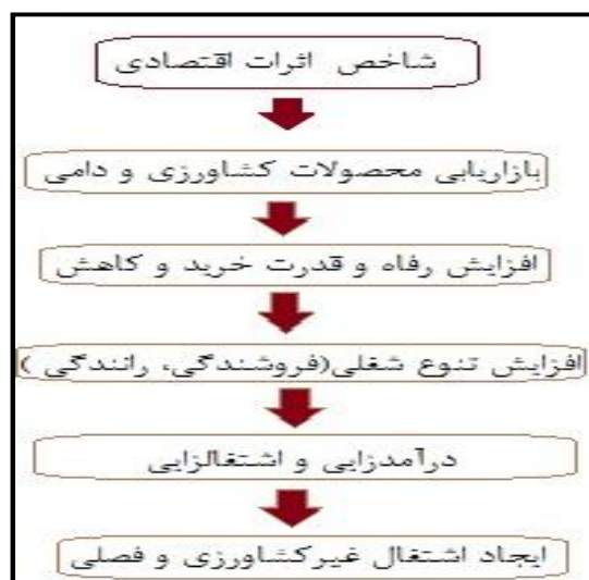
شکل شماره (۱): مدل مفهومی اثرات اقتصادی شهرک صنعتی آق قلا

صنعتی‌سازی نواحی روستایی باشد (دریان‌آستانه، ۱۳۸۳: ۷۷). نواحی صنعتی موجب افزایش درآمد روستاییان و کاهش اختلاف درآمد بین شهرنشینان و روستاییان گردیده (Sunder, 2009: 28-29) و میان آن‌ها پیوند ایجاد می‌کند؛ همچنین صنایع روستایی به تحکیم الگوی عدم تمرکز صنایع می‌انجامد (Walker, 2007: 3). با توجه به رشد بالای جمعیت و محدودیت زمین کشاورزی، صنایع روستایی می‌تواند با ایجاد فرصت‌های شغلی جدید نسبت قابل قبولی از نیروی کار را جذب نموده و آهنگ رشد نرخ بیکاری را کاهش دهد و زمینه را برای توسعه روستاها هموارتر سازد (Maran, 2007: 86). صنعت علاوه بر افزایش نرخ اشتغال، به‌عنوان یکی از بخش‌های غیرکشاورزی، منجر به افزایش درآمدهای غیرمحل‌ی گردیده و به صورت مستقیم و غیرمستقیم در مدرنیزاسیون بخش کشاورزی نیز نقش عمده‌ای دارد (Das, 2009: 1). صنعتی‌سازی روستاها منجر به تحول در اقتصاد روستایی گردیده و با جذب قسمتی از جمعیت روستا، تا حدی مشکل بیکاری را مرتفع نموده است (Sunder, 2009: 29)؛ همچنین با برقراری پیوند با کشاورزی، موجبات رشد آن را فراهم می‌آورد (Hwa, 1989: 45). به همین دلیل صنعتی شدن جایگاه مهمی در راهبردها و سیاست‌های کشورهای در حال توسعه دارد (Dutta, 2004: 334). استقرار صنایع در روستا قادر است فرصت‌های شغلی و درآمدی بیشتر ایجاد کند و از این رو بستر مناسبی برای توسعه روستایی به‌شمار می‌آید (حاجی‌نژاد، ۱۳۸۵: ۲۰).