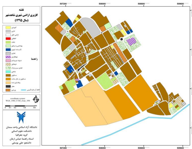
شکل شماره (۲) نقشه کاربری اراضی شاهد شهر در سال ۱۳۹۵