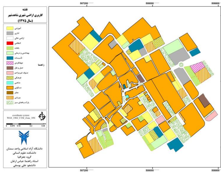
شکل شماره (۱) نقشه کاربری اراضی شاهد شهر در سال ۱۳۷۵