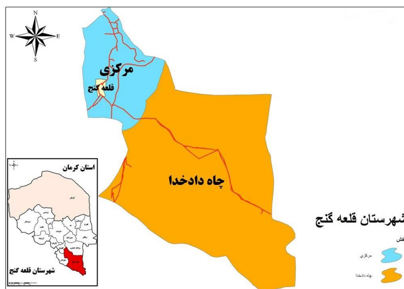
شکل ۱. نقشه موقعیت جغرافیایی محدوده مورد مطالعه

شهرستان قلعه گنج بین ۲۷ درجه عرضی و ۵۷ درجه طول جغرافیایی قرار گرفته است، از شمال به شهرستان کهنوچ، از جنوب به بندر جاسک، از جنوب شرق به استان سیستان و بلوچستان ( شهرستان های ایرانشهر و نیک شهر )، از شرق به شهرستان رودبار از غرب به منوجان محدود می‌شود. مساحت شهرستان ۱۴۲۰۰ کیلومتر مربع معادل ۳/۳ درصد از کل مساحت استان است و فاصله تا مرکز استان ۴۲۰ کیلومتر است. شهرستان قلعه گنج دارای ۲ بخش مرکزی و چاه دادخدا و ۵ دهستان به نامان دهستان رمشک، مارز، چاه دادخدا، قلعه گنج و سرخ قلعه است.