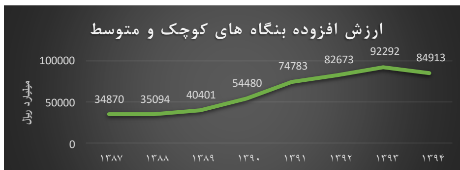
شکل ۱. نمودار ارزش افزوده بنگاه‌های کوچک و متوسط

ارزش افزوده کسب و کارهای کوچک و متوسط همانطور که در شکل (۱) ملاحظه می‌شود دارای روند صعودی از سال ۱۳۸۷ تا سال ۱۳۹۳ می‌باشد و تنها در سال ۱۳۹۴ به دلیل نرخ تورم و سایر نوسانات بازار کالا کاهش یافته است. به بیان دیگر می‌توان این گونه گفت که در تمامی سال‌های مورد بررسی روند ارزش افزوده، روندی صعودی بوده و تنها در سال آخر به دلیل تضعیف توان بنگاه‌های کوچک و متوسط دارای ارزش افزوده کاهشی بوده‌اند. ارزش افزوده در سال ۱۳۸۷ با رقم ۳۴,۸۷۰ میلیارد ریال شروع و تا سال ۱۳۹۳ حدود سه برابر و به رقم ۹۲,۲۹۲ میلیارد ریال رسیده است و با کاهش در سال ۱۳۹۴ به رقم ۸۴,۹۱۳ میلیارد ریال رسیده است.