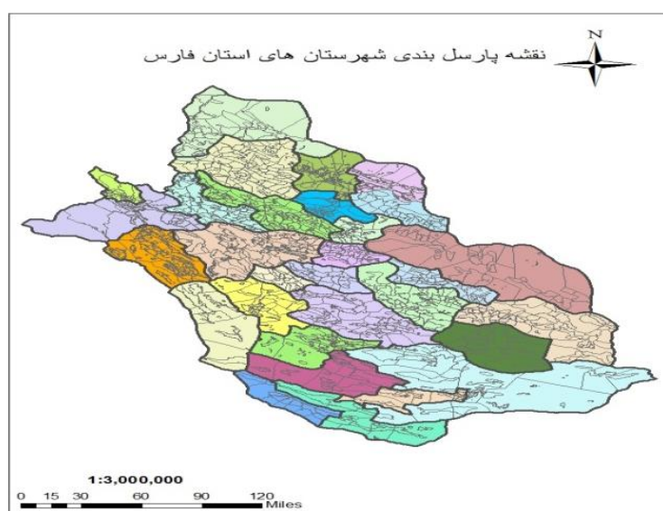
شکل ۲. نقشه موقعیت جغرافیایی و پارسل‌بندی استان فارس

استان فارس یکی از ۳۱ استان ایران است که در بخش جنوبی کشور واقع شده است. مساحت استان حدود ۱۲۲۶۰۸ کیلومتر مربع است که ۷/۵ درصد از مساحت کل کشور را شامل می‌گردد. در استان فارس طرح پهنه‌بندی عرصه‌های تولیدی با ۶۱۲ پهنه (پاسل) اجرا شد. برای هر پهنه یک کارشناس در حوزه روستا یا دهستان مشخص گردید و از سوی مرکز تحقیقات کشاورزی استان فارس برای هر شهرستان کارشناسی برای نظارت کلی بر کارشناسان پهنه‌ها در نظر گرفته شد.