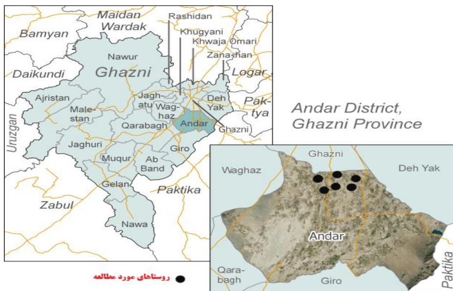
شکل ۱. موقعیت جغرافیایی محدوده مورد مطالعه در کشور افغانستان، استان غزنی، شهرستان اندر