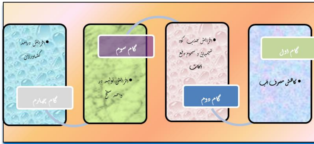
شکل ۳. اثرات کشت هیدروپونیک

الگوریتم خوشه‌ای کردن روستاها به منظور ظرفیت‌سنجی کشت هیدروپونیک با روش تحلیل خوشه-ای