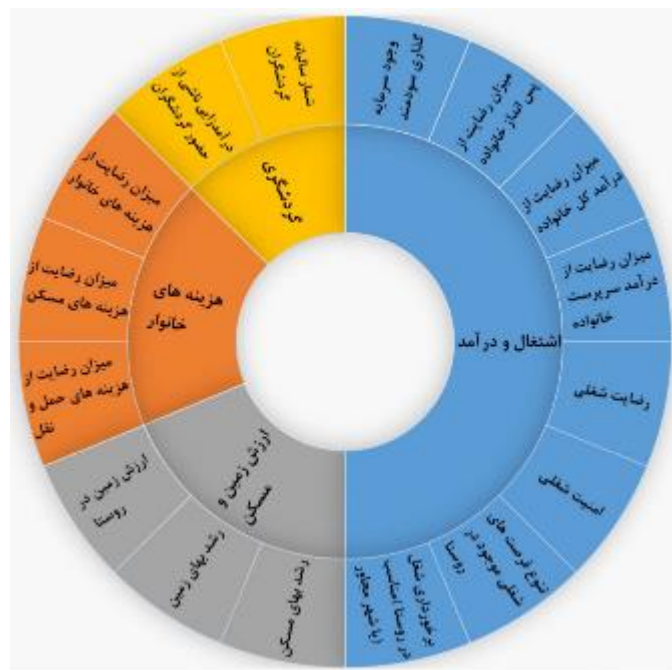
شکل ۱. مدل مفهومی پژوهش