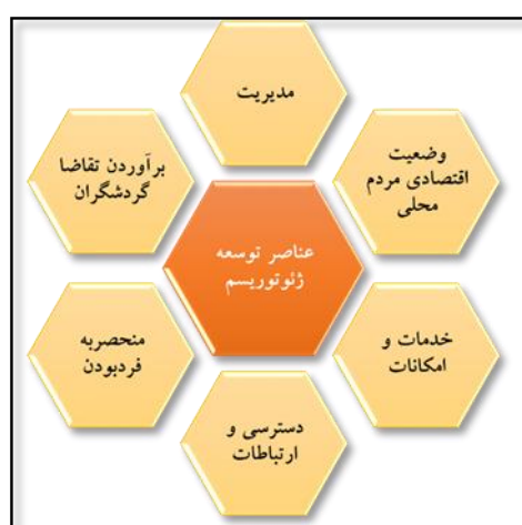
شکل ۱. عناصر اصلی اثرگذار بر توسعه ژئوتوریسم در مقاصد از دیدگاه گنتینگ و فبری.

پایدار جوامع محلی خواهد بود (Wéber et al, 2015:318). روچا و سیلوا (۲۰۱۴)، بیان می‌کنند؛ زمانی که از توسعه ژئوتوریسم، سخن گفته می‌شود؛ یکی از محورهای اصلی آن ارزش‌های طبیعی و جاذبه‌های آن بوده و محور بعدی آن، مرتبط با مطلوبیت وضعیت مدیریت، خدمات و امکانات، پشتیبانی مالی، ارائه بسته‌های متنوع به ژئوتوریست‌ها، سازماندهی و ارتباطات گروه‌ها و بازیگران درگیر، رضایت گردشگران، وضعیت حفاظت، بهره‌مندی اقتصادی جامعه محلی، ارتباط مردم محلی با ژئوتوریست‌ها و پذیرش آنها خواهد بود (Rocha and Silva, 2014:744). گنتینگ و فبری (۲۰۱۸) نیز، لازمه موفقیت و اثرگذاری ژئوتوریسم را در مطلوبیت عناصر اثرگذار آورده شده در شکل زیر می‌دانند (Ginting and Febri, 2018:2).