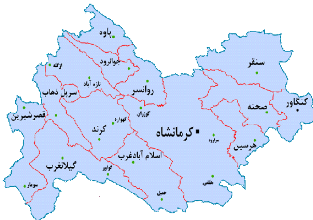
شکل ۱. نقشه استان کرمانشاه و محدوده‌های مکانی پژوهش