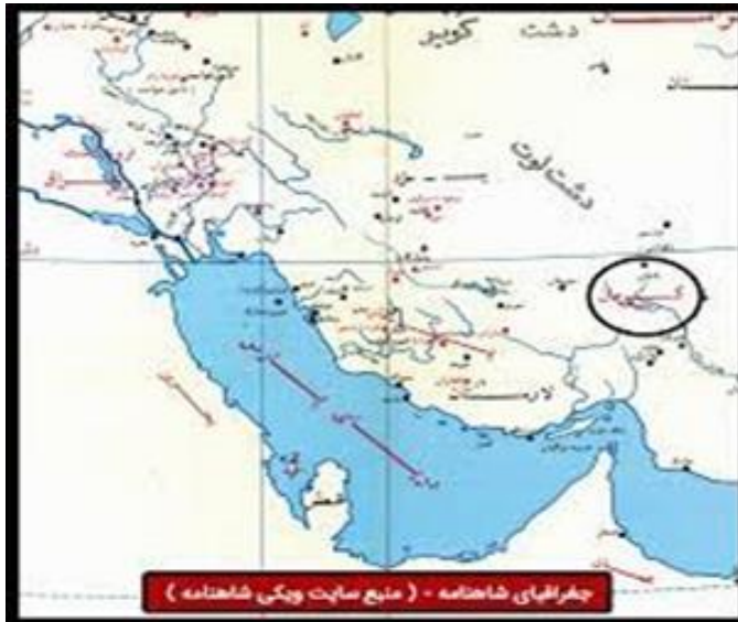
شکل ۲. نقشه موقعیت جغرافیایی محدوده مورد مطالعه

دارای رتبه اول می‌باشد. بارش سالانه در استان حدود ۱۱۰ میلی متر است. تنوع آب و هوایی بالا در استان کرمان باعث شده است که این استان دارای محصولات کشاورزی متنوع شامل محصولات گرمسیری و نیمه گرمسیری و درختان میوه مناطق سردسیری باشد.