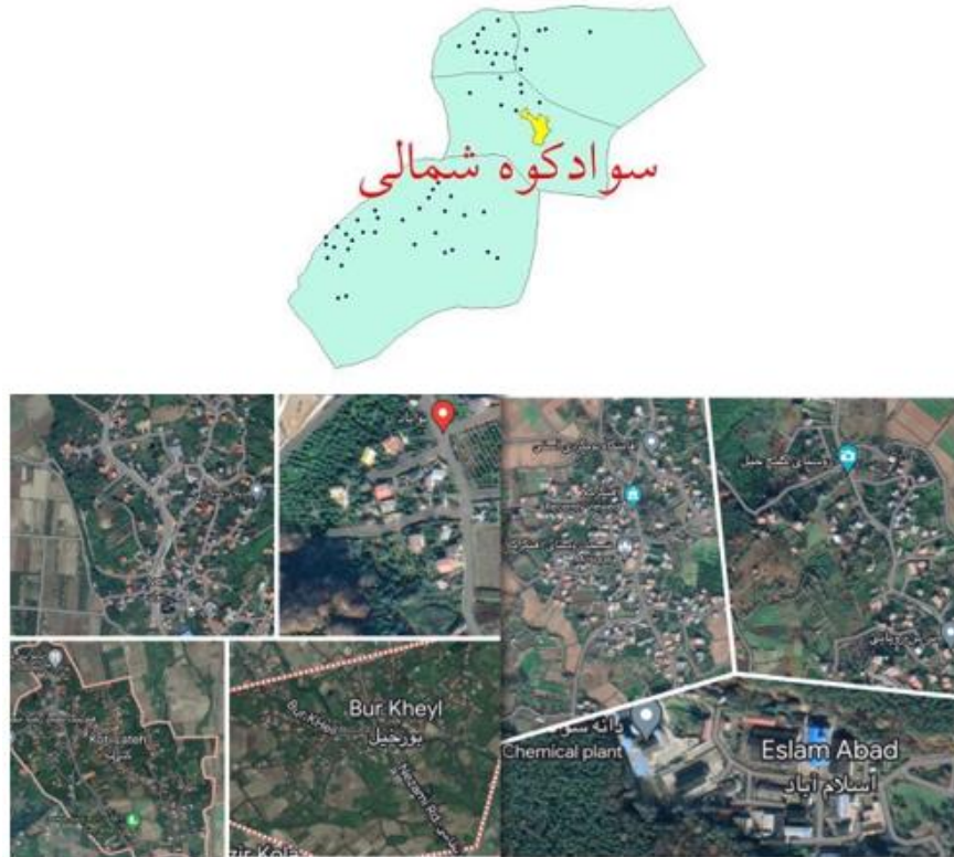
شکل ۲. محدوده مورد مطالعه در تقسیمات استان مازندران