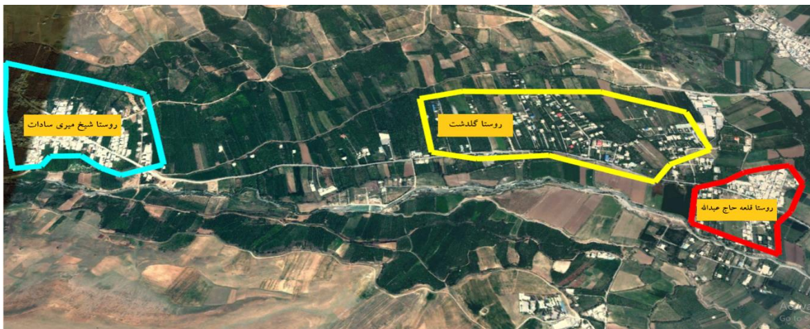
شکل ۳. منطقه روستا شهری گلدشت در سال ۱۳۹۰، مأخذ (گوگل ارث، ۱۴۰۲)