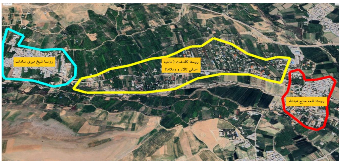
شکل ۴. منطقه روستا شهری گلدشت در سال ۱۴۰۲، مأخذ (گوگل ارث، ۱۴۰۲)