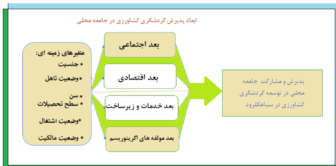
شکل ۱. شاخص های پژوهش

شفریل ۱ و همکاران (۲۰۱۴)، در پژوهشی با موضوع درک جامعه ساحلی از تأثیرات اجتماعی-اقتصادی فعالیت های آگروتوریسم در روستاهای ساحلی مالزی: به بررسی تأثیرات اجتماعی-اقتصادی فعالیت های آگروتوریسم در روستاهای ساحلی نمونه به عنوان دهکده چشم انداز ماهیگیری (DWN) در مالزی می پردازد. با این حال، تمرکز این مطالعات اخیر بیشتر بر گردشگران و چالش های انجام فعالیت های آگروتوریسم بوده است و در نتیجه به تأثیرات اجتماعی و اقتصادی توجه کمتری شده است. در مجموع و براساس چهارچوب نظری پژوهش مشخص شد که متغیرهای زمینه ای و ابعاد موثر بر توسعه گردشگری کشاورزی به شرح شکل ۱ می باشند.